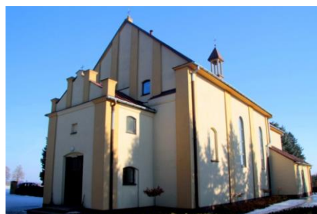
Fotografia 1. Widok na kościół św. Floriana w Łagowie.

pełnił funkcję kościoła parafialnego. W jego kryptach pochowani zostali jego fundatorzy.