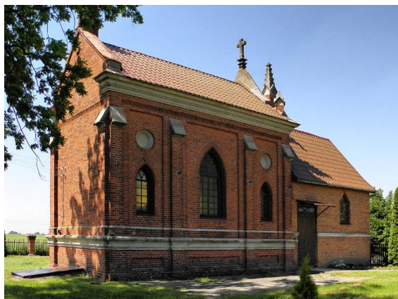
Fotografia 2. Widok na kaplicę grobową rodziny Lenkiewiczów.

Budynek kaplicy wybudowany został w stylu neogotyckim, murowany z cegły o wiązaniu krzyżowym. Został wzniesiony na rzucie prostokąta. Posiada jednokondygnacyjną bryłę. Kaplica przykryta dachem dwuspadowym, pokrycie z dachówki. Gzyms koronujący wielokrotnie profilowany, wydatny. Pod gzymsem biegnie fryz ząbkowany. Elewacje boczne ujęte są płaskimi przyporami, między którymi znajdują się prostokątne płyciny z ostrołukowymi otworami okiennymi. Cokół budynku wydatnie ogzymśowany. Wnętrze trójprzęsłowe, środkowe przęsło jest na rzucie kwadratu.