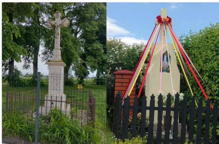
Fotografia 3. Przykład kapliczek i krzyży w Grabowie i Przyłęku.