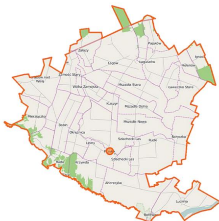
Rysunek 1. Położenie gminy na tle powiatu i województwa.

Granice administracyjne gminy przedstawia poniższy rysunek.